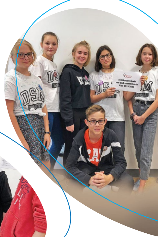
Wahlhelfer bei der SV- und Vertrauenslehrerwahl 2019