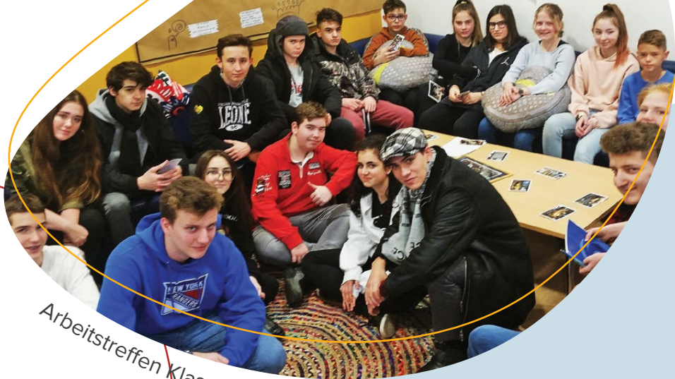
Arbeitsstreffen Klassensprecher und SV 2019